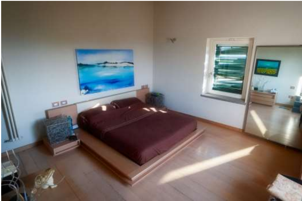
33-Camera 2 abitazione principale