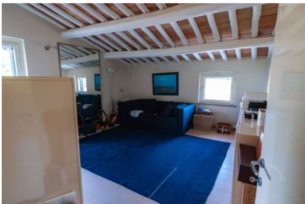
30-Camera 1 abitazione principale