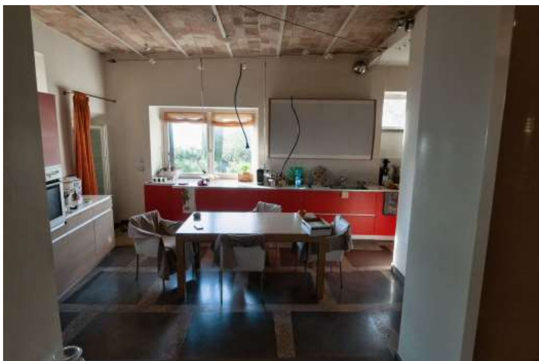
24-Cucina abitazione principale