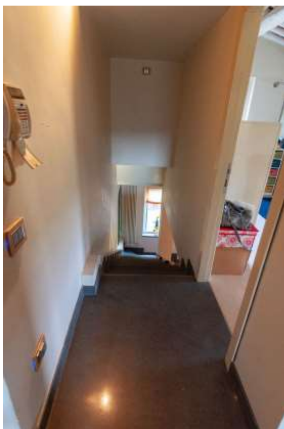
29-Scala di collegamento tra il piano terra e il piano primo abitazione principale