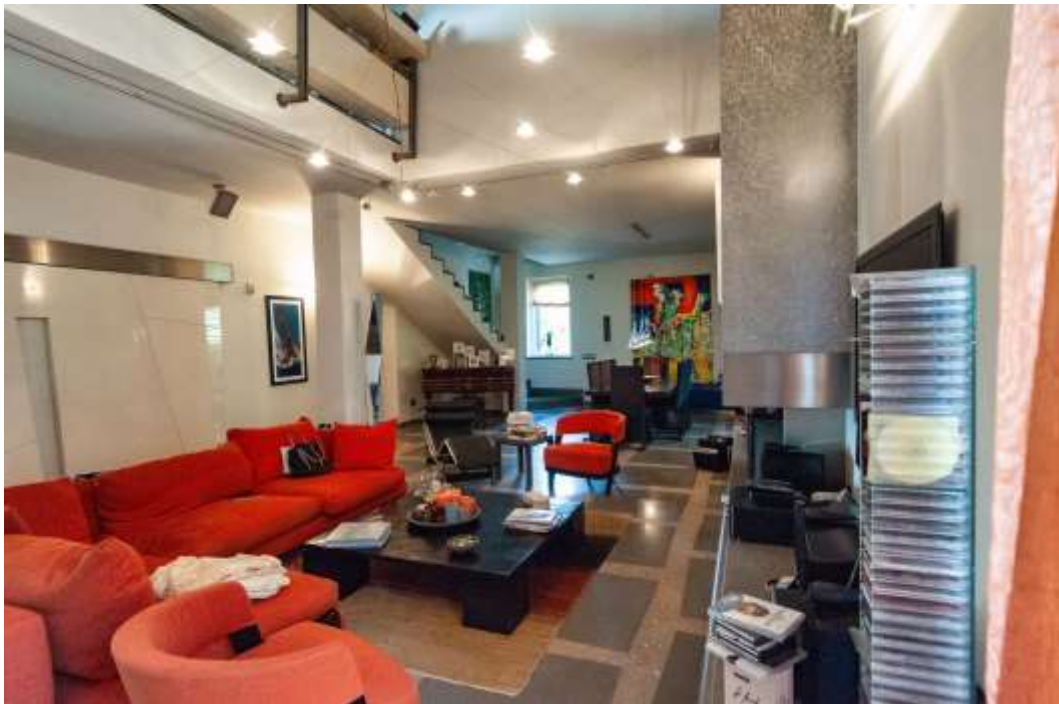
25-Soggiorno abitazione principale