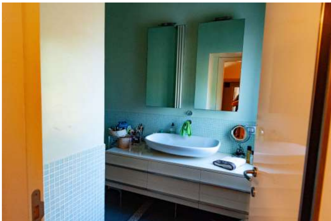
36-Bagno piano primo abitazione principale