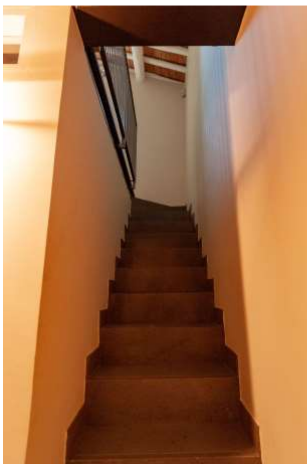
37-Scala di collegamento tra il piano primo e il piano secondo abitazione principale