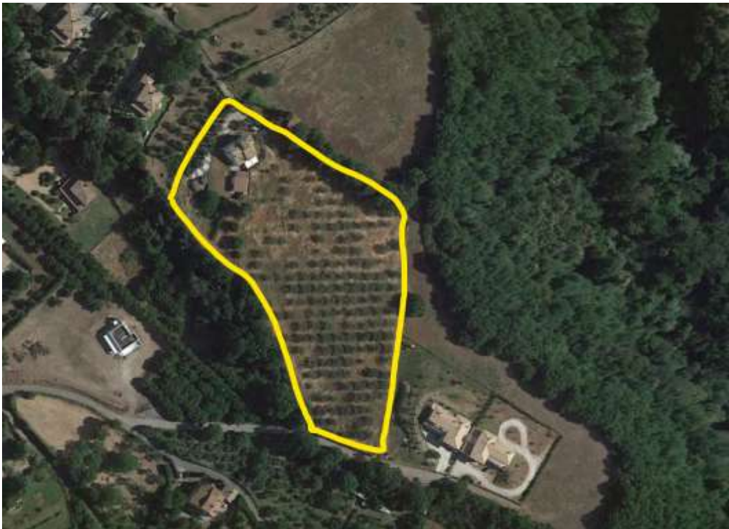
40-Vista aerofotogrammetrica del lotto Strada Monte Pizzo nc.8