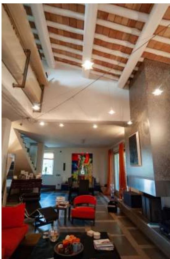
28-Soggiorno abitazione principale