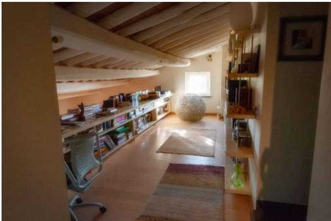
32-Disimpegno sottotetto abitazione principale