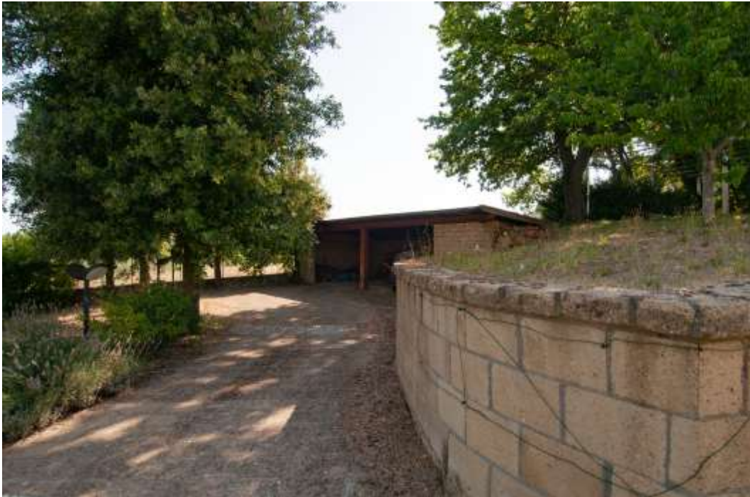
19-Esterno-tettoia box auto