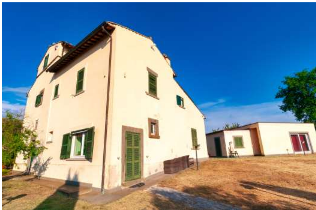
14-Esterno-abitazione principale e dependance