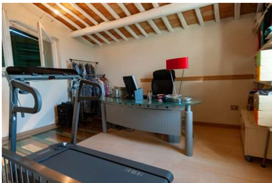
38-Camera 3 piano secondo abitazione principale