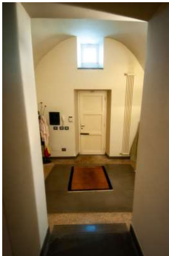
22-Ingresso abitazione principale