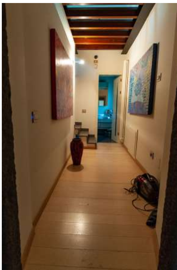
35-Disimpegno al piano primo abitazione principale