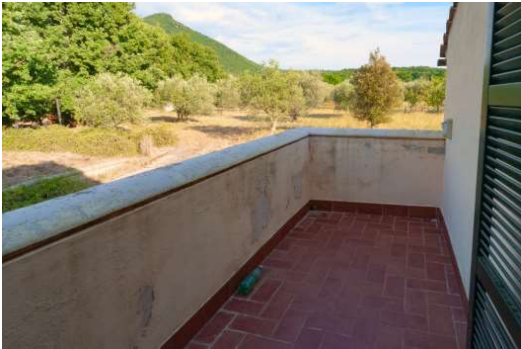
31-Balcone su Camera 1 abitazione principale