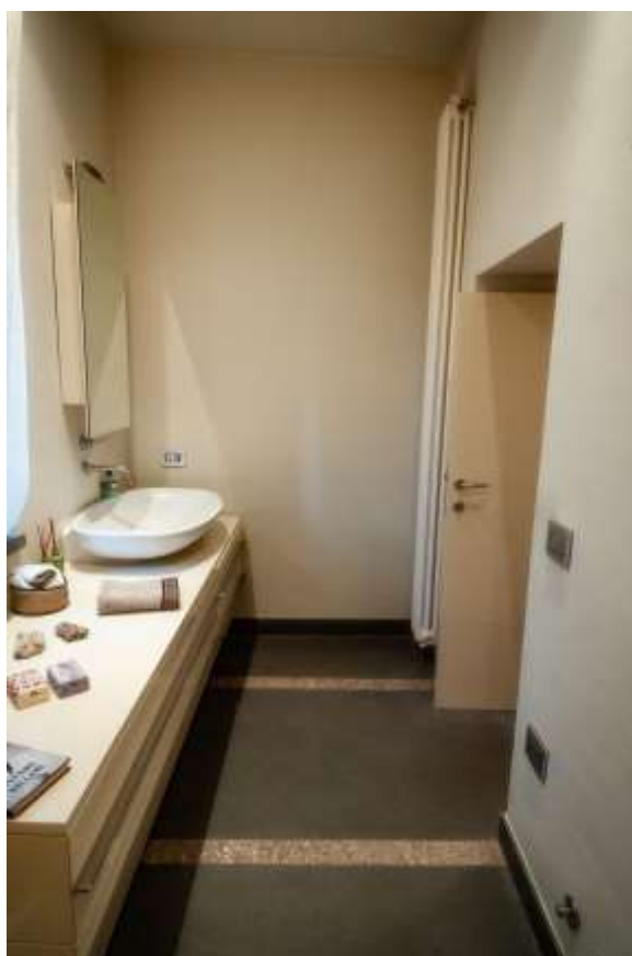
23-Bagno piano terra abitazione principale