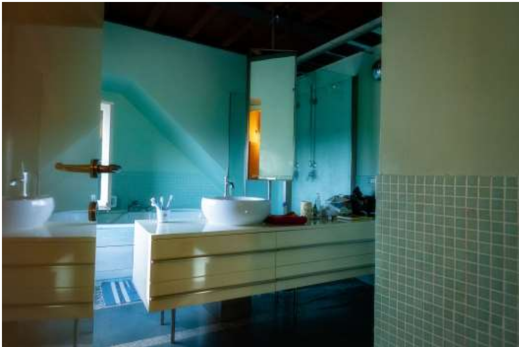
34-Bagno su Camera 2 abitazione principale