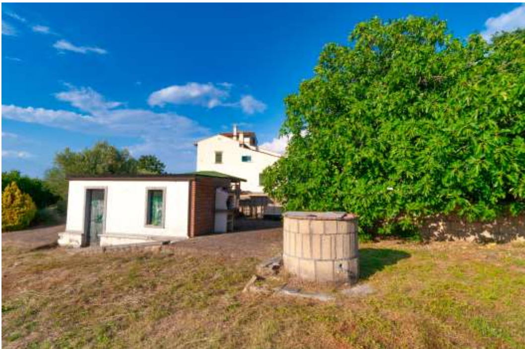
16-Esterno-magazzino e pozzo