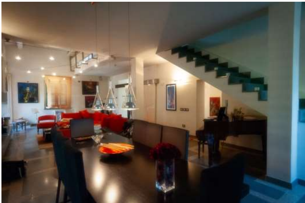
26-Soggiorno abitazione principale